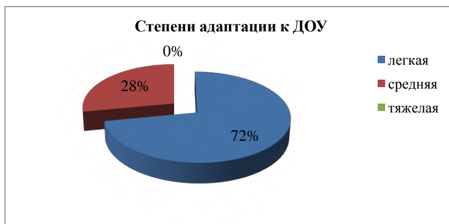
Рис.1 Распределение степени адаптации к ДОУ

Анализ адаптационных листов показал, что 72% детей имеют высокий уровень адаптации к дошкольному учреждению, 28% - средний уровень адаптации (рис.1).